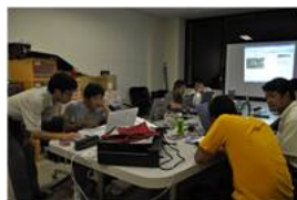
パソコンサークル