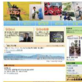
富士町コミュニティ