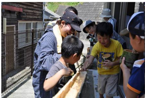
ファミリー向け山体験