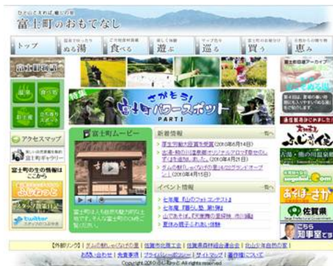
富士町ポータルサイト