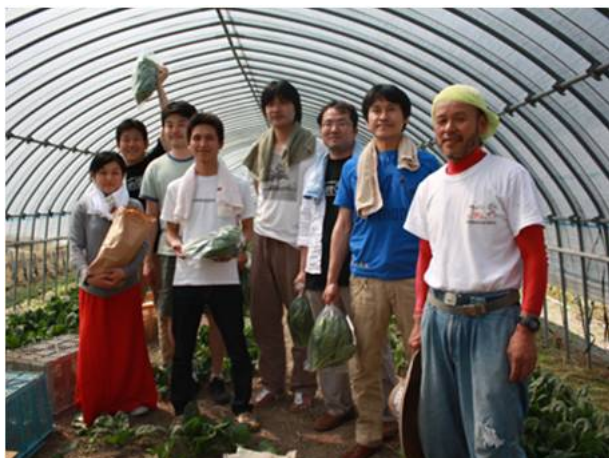
社会人向け農業体験