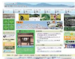
富士町のおもてなし