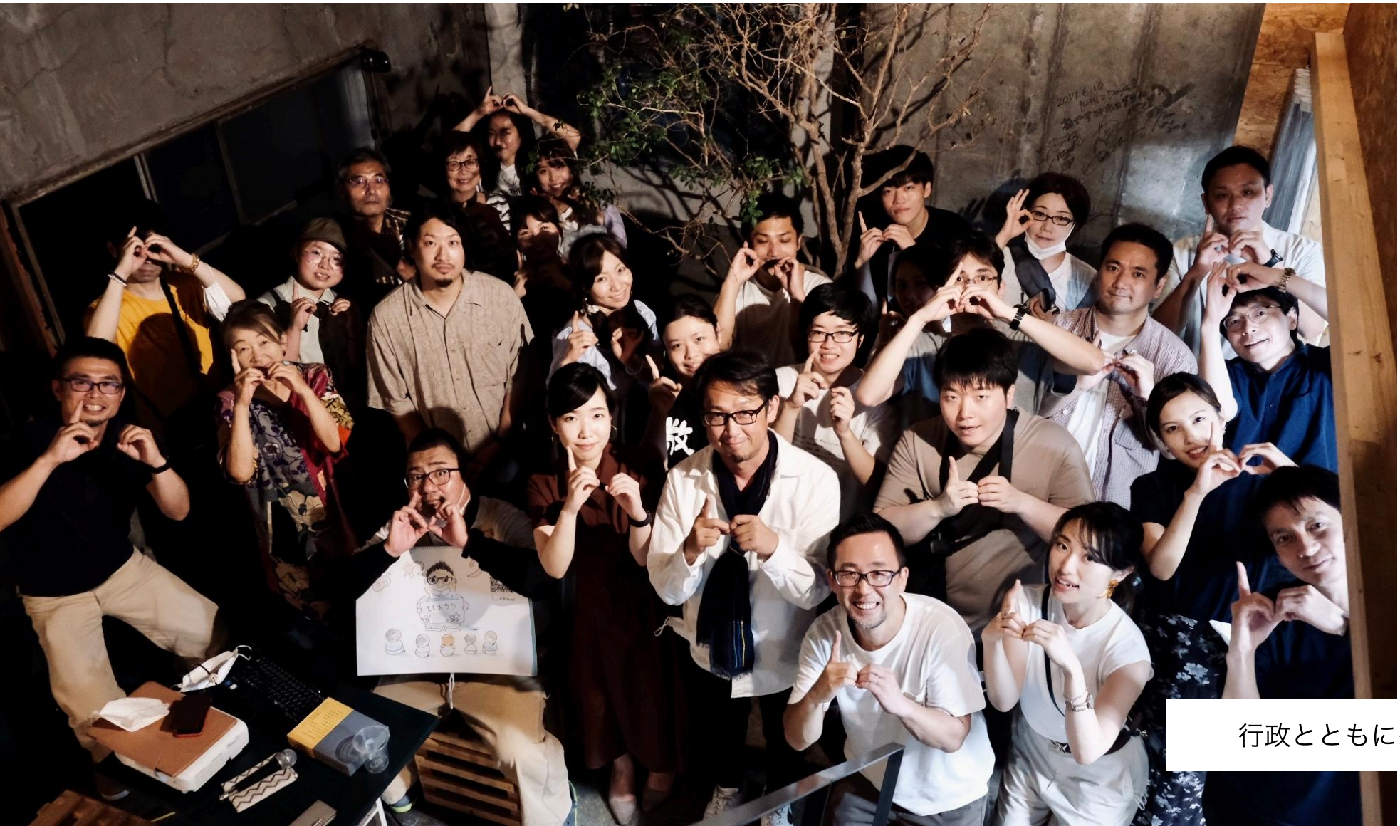
行政とともにイベント