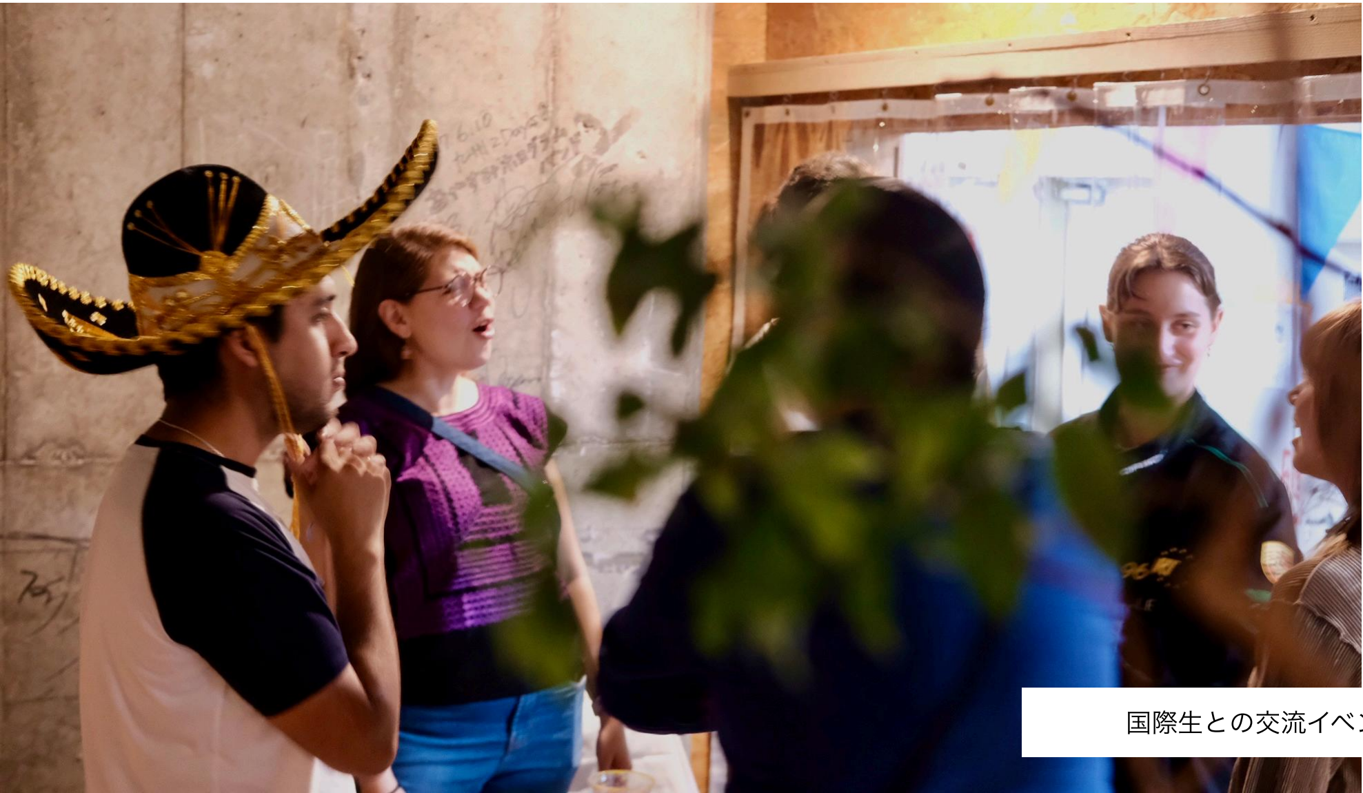
国際生との交流イベント